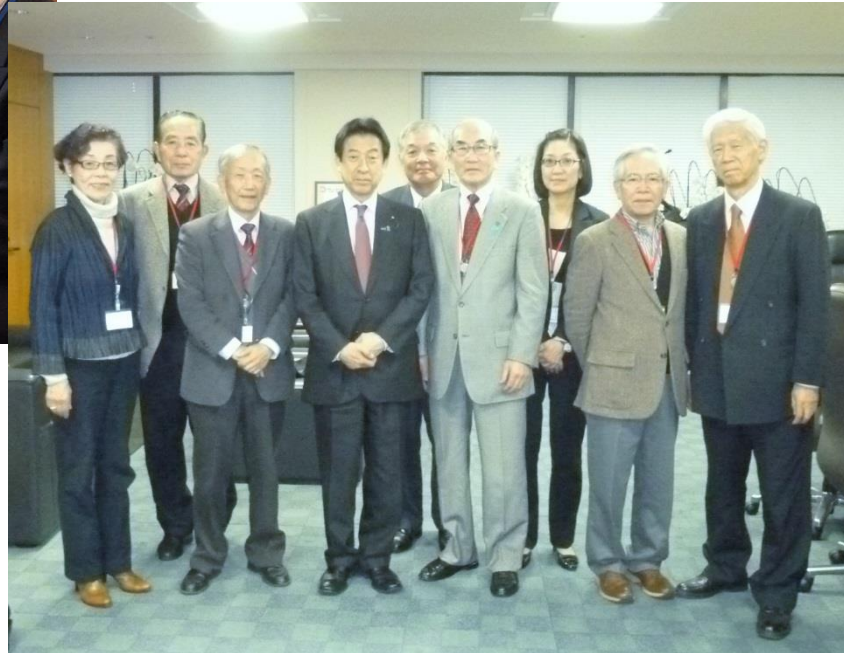
塩崎厚生労働大臣と