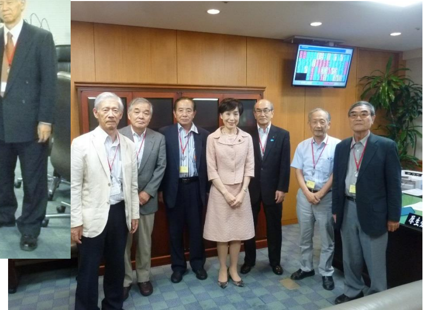
古屋副厚生労働大臣と